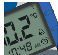
Ajastin ja hälytykset