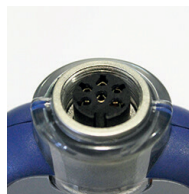
Kestävä Lumberg- liitin

Kestävä, vesitiivis polykarbonaattikotelointi BioCote® suojauksella