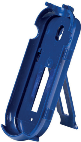
C20WB seinäteline tai tuki ▪ C4x ja BT4x sarjan mittareille