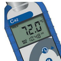
Max/Min näyttää maksimi- ja minimilämpötilat