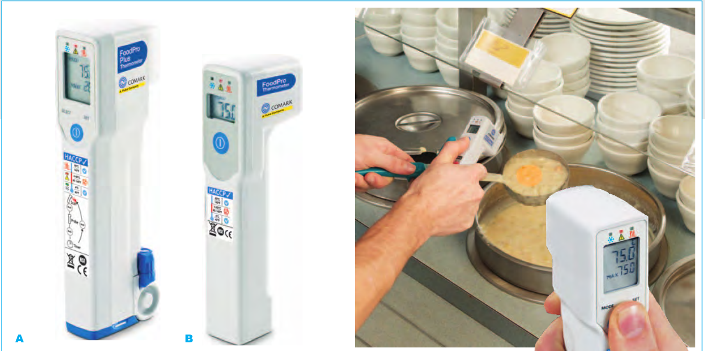
A: FoodPro Plus infrapunalämpömittari, sis. anturi ja ajastin B: FoodPro infrapunalämpömittari