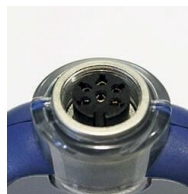
Kestävä Lumberg- liitin

Kestävä, vesitiivis polykarbonaattikotelointi BioCote® suojauksella