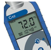
Max/Min näyttää maksimi- ja minimilämpötilat