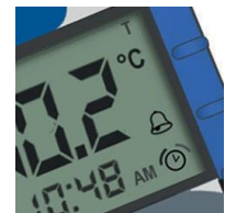
Ajastin ja hälytykset